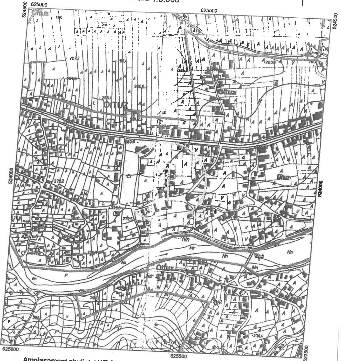
Amplasament studiat, UAT Oituz (nr. 1208,1210)